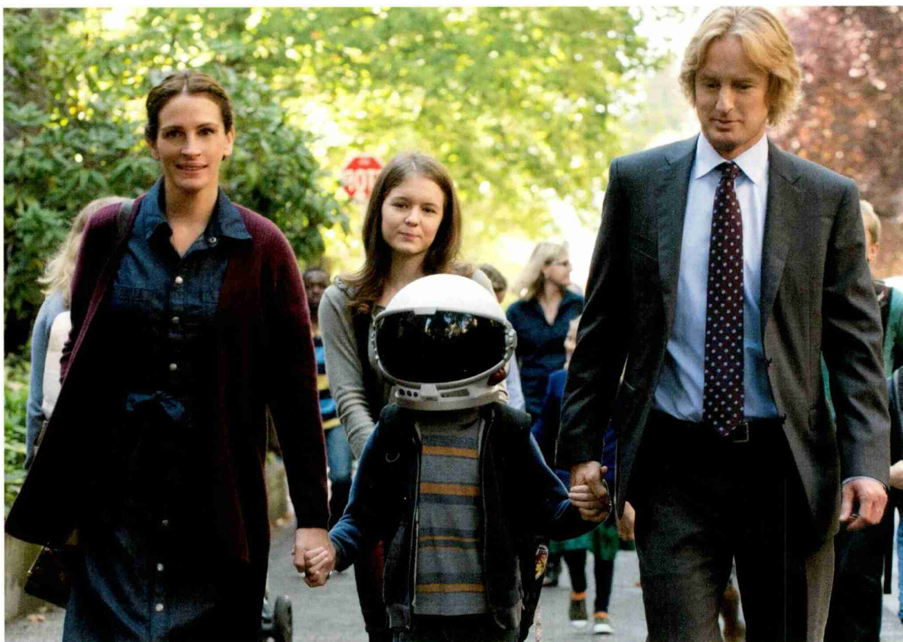
Un'immagine dal film Wonder in programma il 23 ottobre.