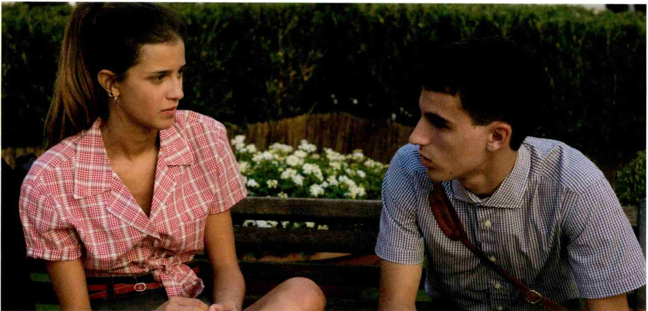
Un frame dal film Quanto basta . Sarà proiettato il 20 novembre al Lux di Massagno.