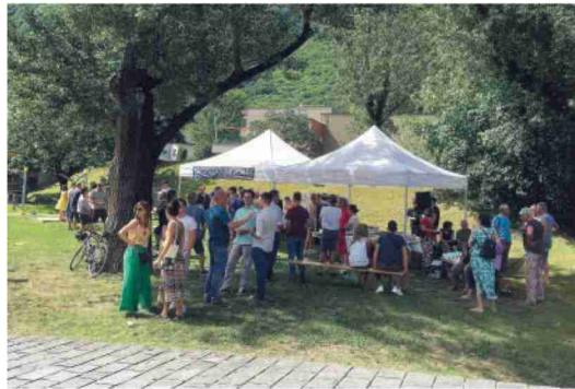
L'inaugurazione di sabato scorso