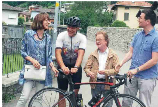
Col sindaco e i rappresentanti di Autismo Svizzera italiana